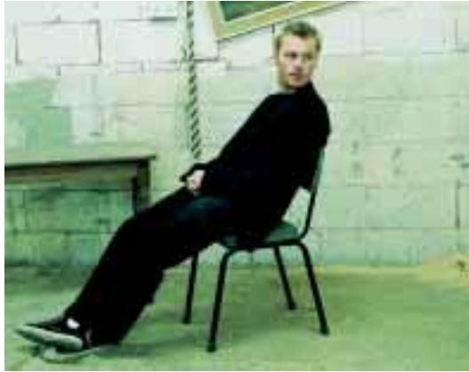
Ronan Keating, Sänger