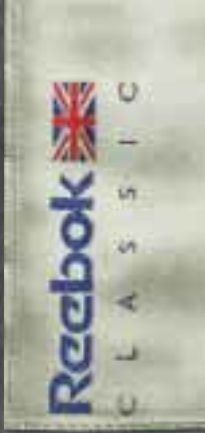
SHAKIRA is wearing the Reebok Classic Valiant