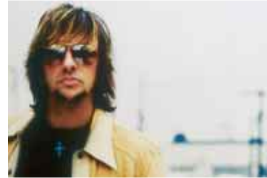
Richie Sambora , Gitarrist